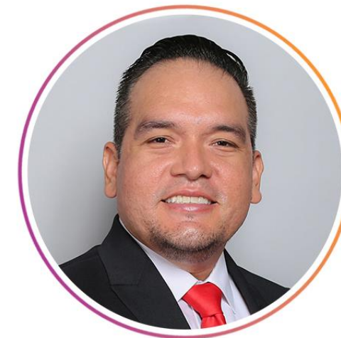
Dip. Iram Leobardo Solís García

Así como al resto de los miembros de la Comisión de Presupuestos y Asuntos Municipales como apertura y disposición al diálogo con la sociedad civil organizada.