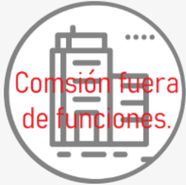
Comisión de Organismos Descentralizados