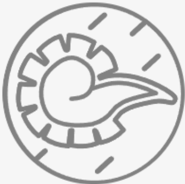
Comisión de Asuntos Étnicos