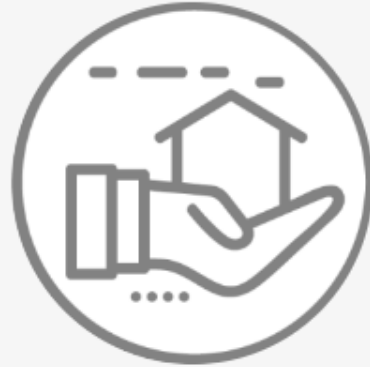
Comisión de Ecología y Desarrollo Sustentable