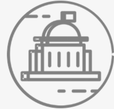
Comisión de Gobernación y Reglamentación Municipal