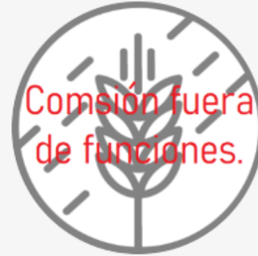
Comisión de Agricultura y Ganadería