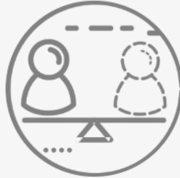
Comisión de Desarrollo de la Mujer y Asistencia Social