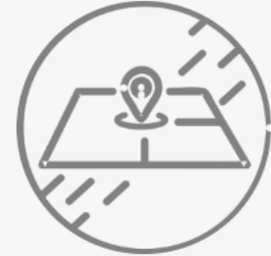
Comisión de Comisarías y Delegaciones