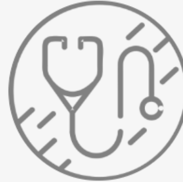
Comisión de Salud Pública