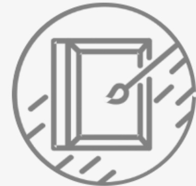
Comisión de Educación y Cultura; Recreación y Deporte