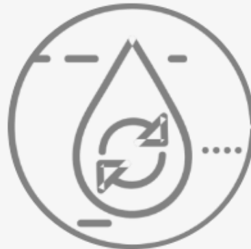
Comisión de Desarrollo del Agua