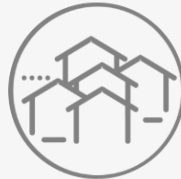
Comisión de Desarrollo Urbano, Obras Públicas, Asentamientos Humanos y Preservación Ecológica