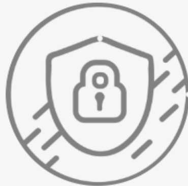
Comisión de Seguridad Pública y Tránsito