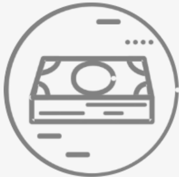
Comisión de Hacienda, Patrimonio y Cuenta Pública