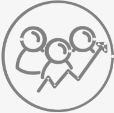
Comisión de Fomento al Desarrollo Económico y Social